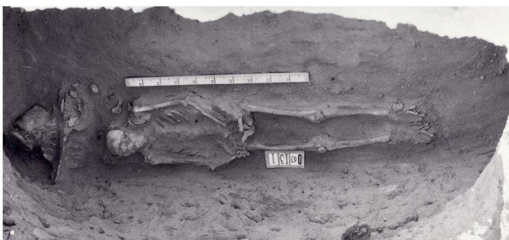
Рис. 3. 1, 2 – фотографии погребения 1 из кургана 13 могильника Ордынский бугор (вид с юго-востока), по: [Маловицкая, 1963]