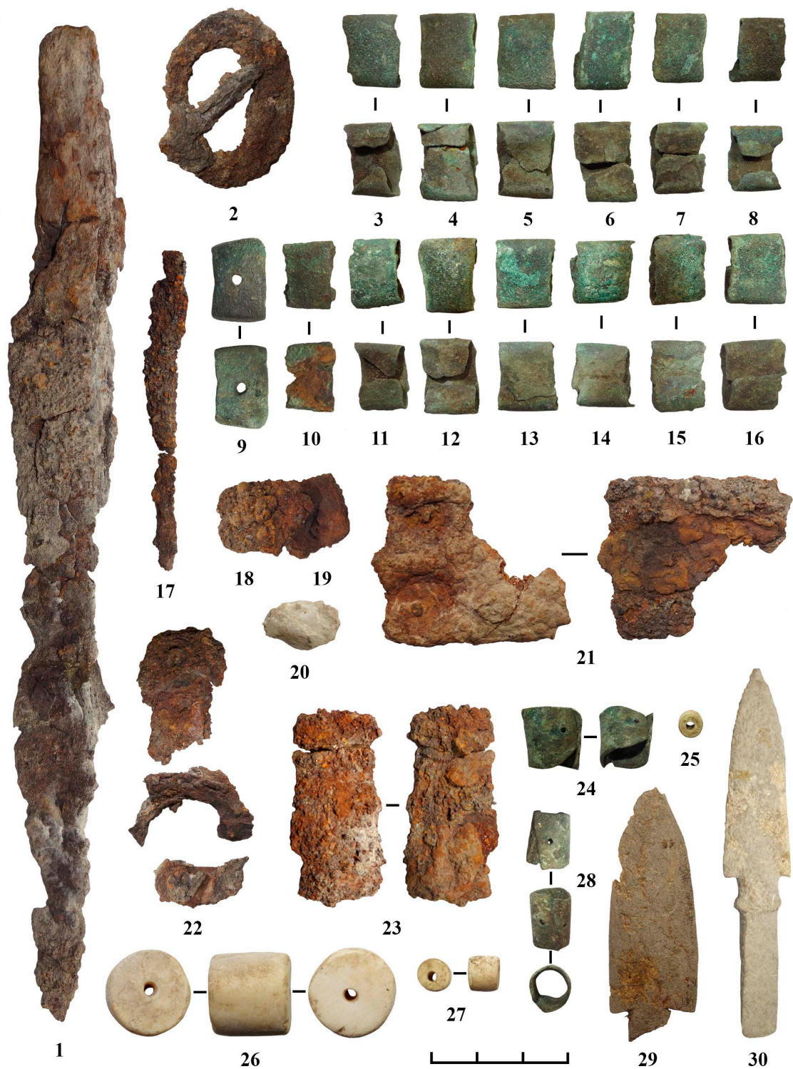
Рис. 5. Карбан-I, курган 11. Оружие, снаряжение, орудия труда и украшения из погребения:

1 – боевой нож; 2 – поясная пряжка; 3–16, 18–19, 21–23 – поясные бляхи; 17 – шило; 20 – каменный предмет (кресало или амулет?); 24, 28 – наконечники; 25–27 – бусы; 29–30 – наконечники стрел