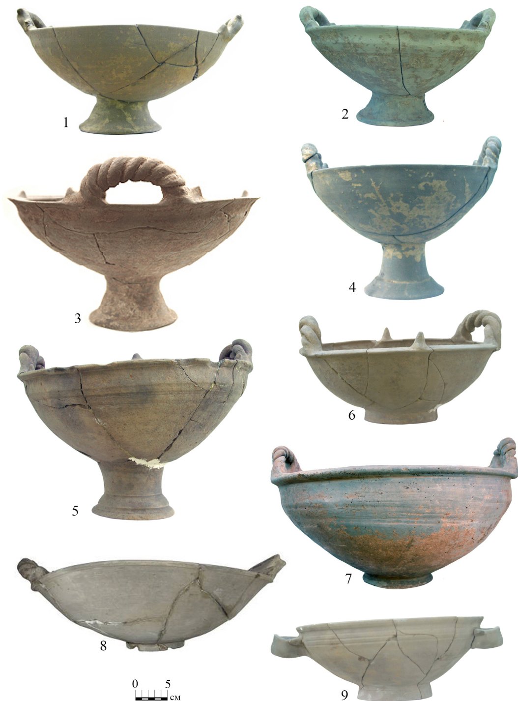
Рис. 3. Меотские вазы (1–7) и лекана (9):

1–6 – Прикубанский могильник (1 – погребение № 61; 2 – погребение № 336; 3 – курган 2, погребение № 7; 4 – погребение № 157; 5 – погребение № 394; 6 – погребение № 209); 7 – могильник Старокорсунского городища № 2, погребение № 238в; 8 – могильник Марьянского поселения I, погребение № 24; 9 – Прикубанский могильник, погребение № 167