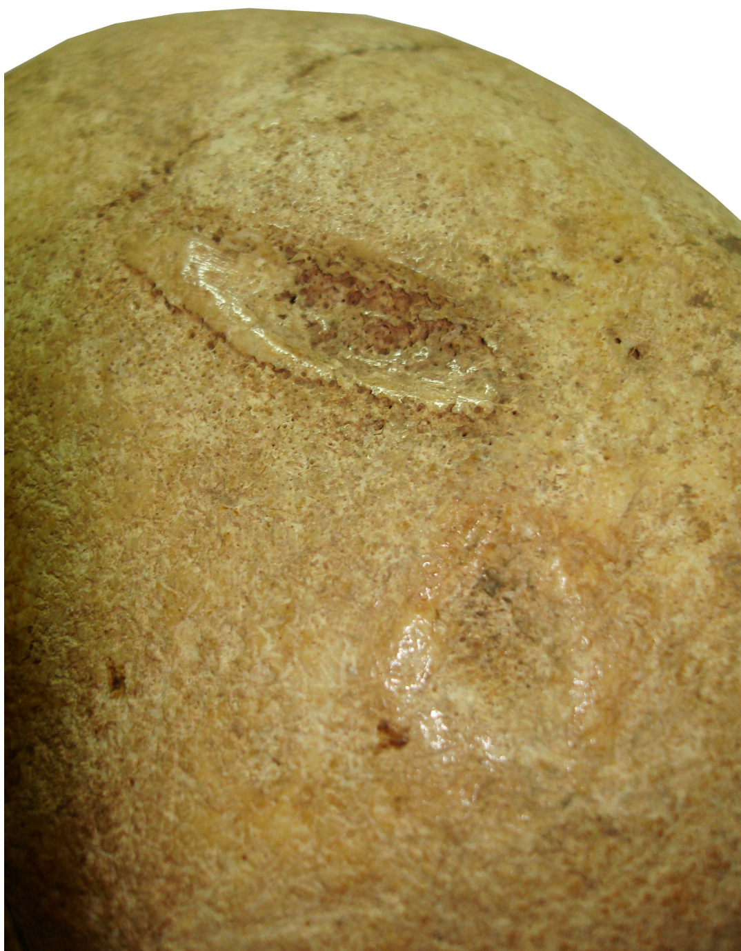
Рис. 3. Пример незажившей травмы после проведения поверхностной трепанации на черепе скелета № 21 энеолитического могильника Хвалы́нск II (по: [Хохлов, 2012, рис. 4])