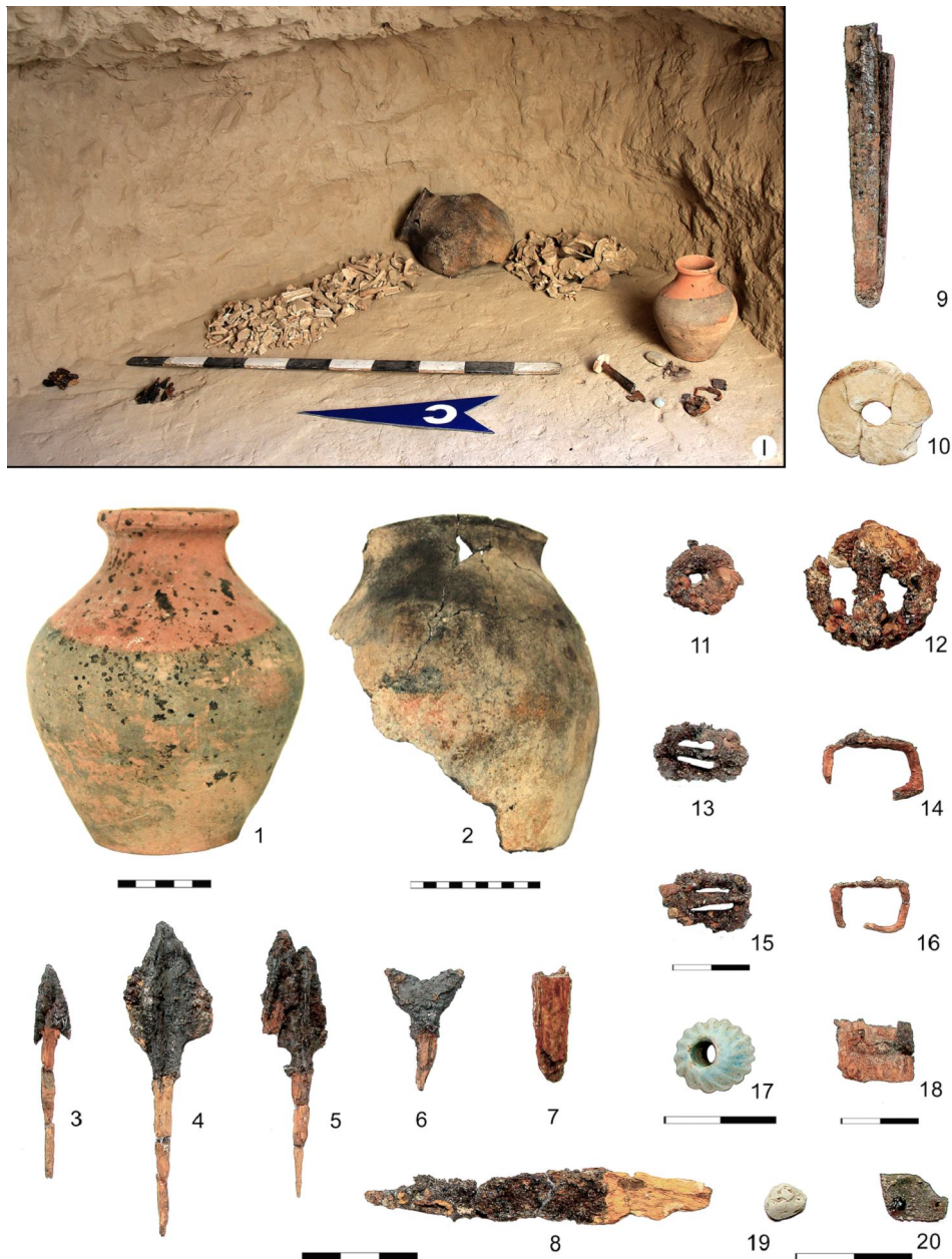
Рис. 2. Археологический комплекс кургана 2 юго-западной группы курганов могильника Кылышжар:

1 – часть полой погребальной камеры и основная масса артефактов; 1 – керамический столовый кувшин; 2 – часть кухонного горшка; 3–5 – железные черешковые трехлопастные наконечники стрел; 6 – железный вильчатый двулопастной наконечник стрелы; 7 – часть железного черешка от ножа; 8 – железный черешковый нож; 9 – железный черешок кинжала; 10 – каменное навершие от железного кинжала; 11 – круглая железная пряжка без язычка; 12 – крупная круглая железная пряжка с подвижным язычком, атрибут конской экипировки; 13, 15 – прямоугольные железные пряжки с подвижным язычком, атрибуты кожаной обуви; 14, 16 – железные скобы; 17 – ребристая бусина из египетского фаянса; 18 – часть железной втулки с остатками дерева, атрибут ножен кинжала; 19 – меловой амулет; 20 – часть бронзовой декоративной пластины со шляпками от заклепки