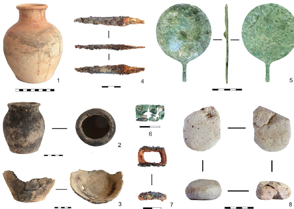
Рис. 3. Археологический комплекс кургана 8 юго-западной группы курганов могильника Кылышжар:

I – погребение в катакомбе, вид сверху; 1 – кувшин керамический столовый; 2 – горшок керамический кухонный; 3 – фрагмент донца и нижней части кухонного горшка; 4 – нож железный черешковый; 5 – зеркало бронзовое дисковидное с боковой ручкой-штырем; 6 – декоративная бронзовая пластина прямоугольной формы с клепками-фиксаторами; 7 – железная пряжка прямоугольной формы с остатками дерева; 8 – амулет алебастровый