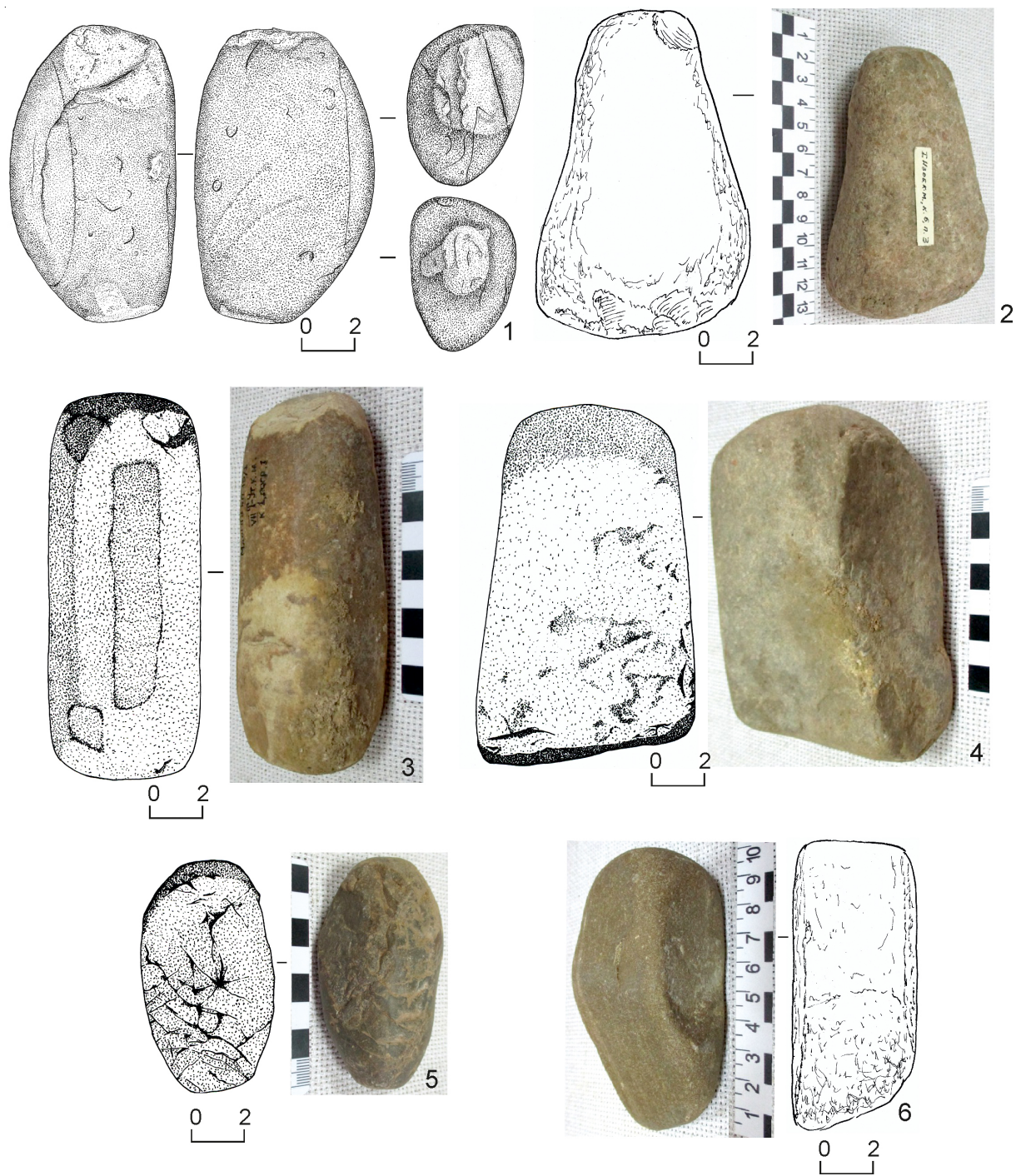
Рис. 2. Орудия из камня для металлопроизводства в погребальных комплексах ямной культуры:

1 – кузнечный молоток, КМ Болдырево 1/1; 2 – пест для дробления медной руды, КМ Изобильное I 6/3; 3–5 – наковальня, молот по рудному материалу, молот для ковки металла, КМ Тамар-Уткуль VII 1/1; 6 – кузнечный молот и гладилка, КМ Тамар-Уткуль VII 4/9