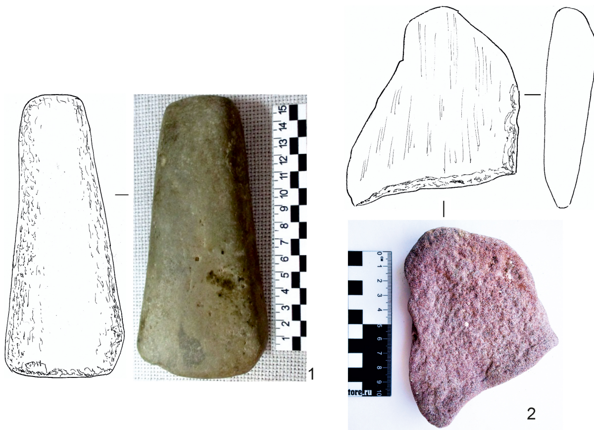
Рис. 4. Орудия из камня для обработки растительности в погребальных комплексах ямной культуры:

1 – КМ Барышников 6/3; 2 – КМ Шумаево II 6/6