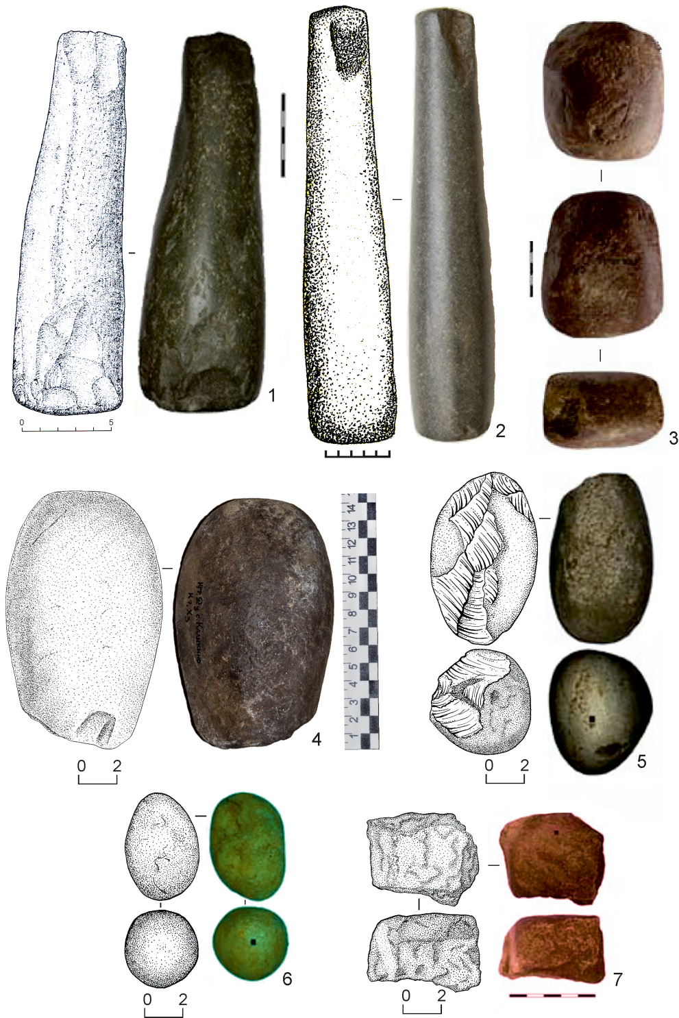
Рис. 3. Орудия из камня для металлопроизводства в погребальных комплексах ямной культуры:

1 – пест, наковальня, КМ Утевский I 1/1; 2 – пест по дроблению и растиранию минералов и руды, КМ Красносамарское I 1/1; 3 – кузнечный молоток, КМ Утевский I 2/1; 4 – кузнечный молот, КМ Каликино II кург. 7, ров; 5 – пест для перетиранья растительности; 6–7 – отбойники по камню, КМ Каликино II кург. 1, ров