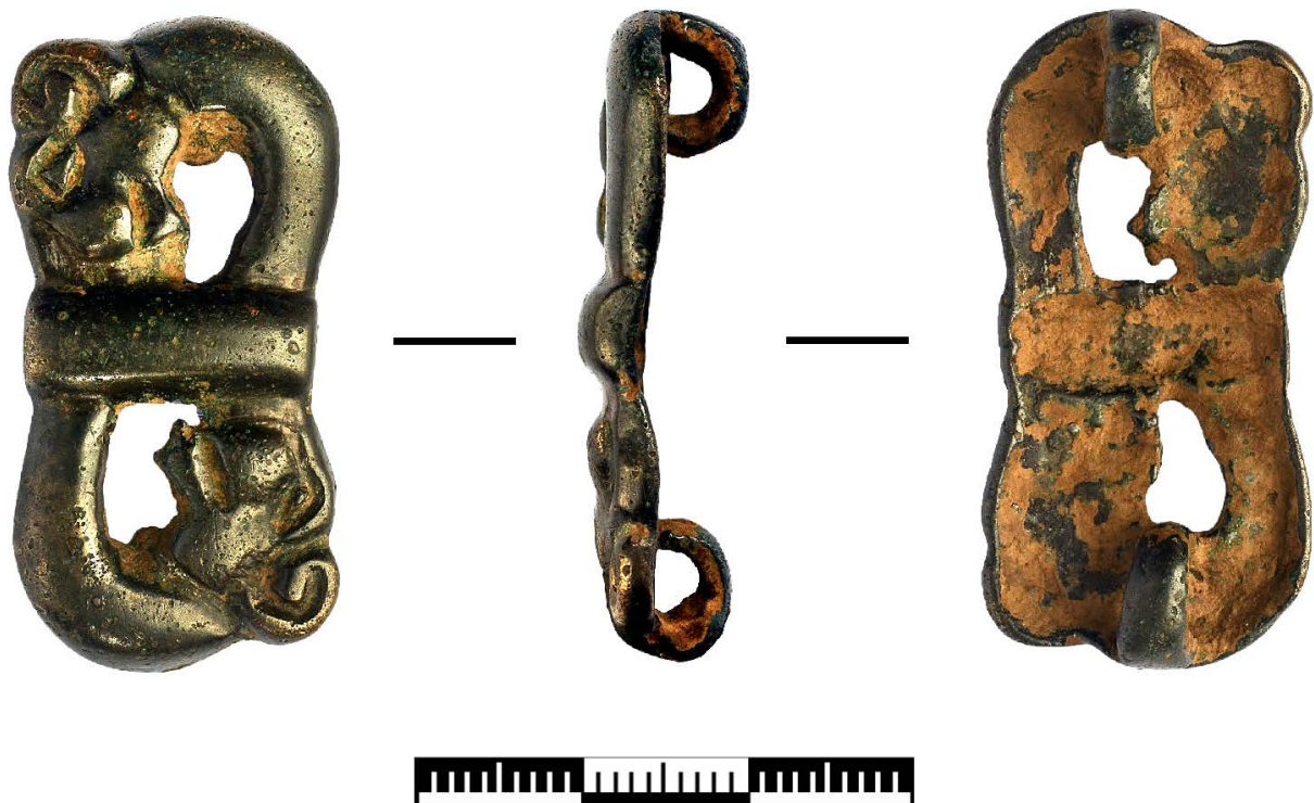
Рис. 3. Бронзовая поясная бляха из ущелья Кызыл-Суу (Внутренний Тянь-Шань) Fig 3. Bronze belt plaque from Kyzyl-Suu Gorge (Inner Tien Shan)