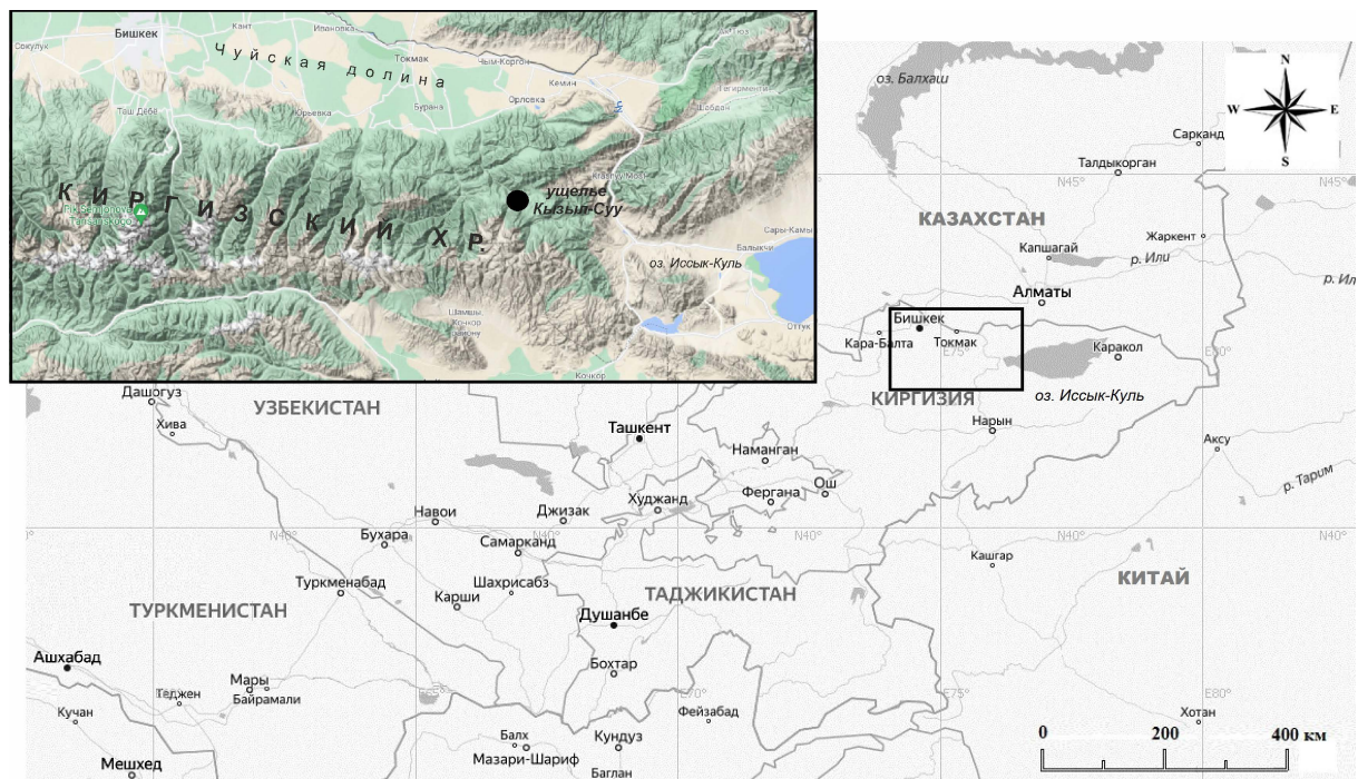
Рис. 1. Место находки поясной бляхи из ущелья Кызыл-Суу Fig 1. Discovery location of the belt buckle in Kyzyl-Suu Gorge