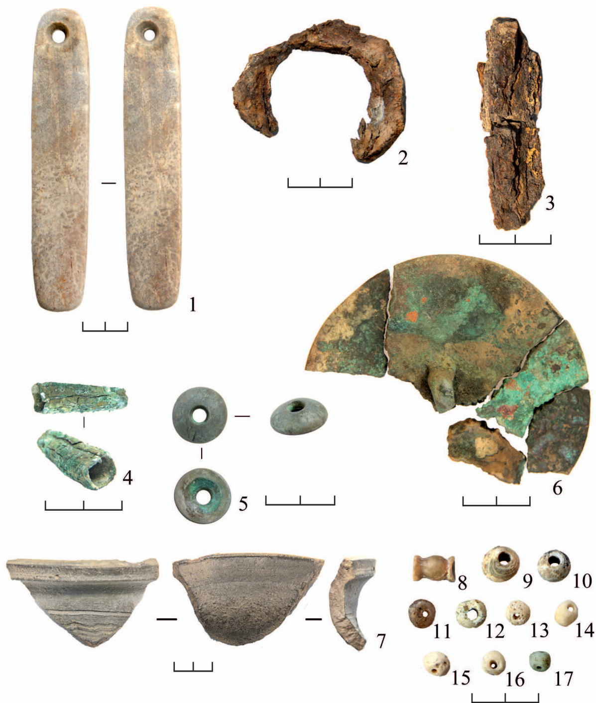
Рис. 3. Находки из погребений:

1 – каменное точило; 2 – железное кольцо; 3 – фрагмент железного кинжала; 4 – бронзовое изделие; 5 – бронзовая ворворка; 6 – бронзовое зеркало; 7 – фрагмент керамики; 8–17 – каменные бусы (1–3, 5 – могильник Айыртас-2, кург. 9; 4 – могильник Айыртас-2, кург. 5; 6–17 – могильник Естек, кург. 2)