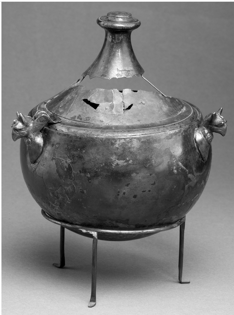
Рис. 4. Турибулум из кургана Хохлач (Государственный Эрмитаж, инв. № ГЭ 2213/26) (по: [Засецкая, 2011, ил. 118])